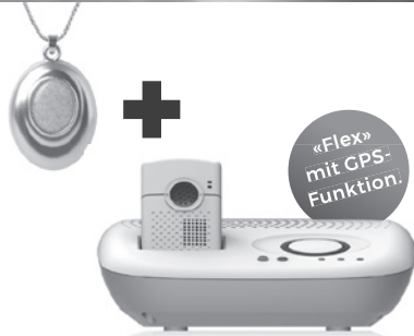
Basisgerät Flex und Medaillon Marmo

Mit dem SmartLife Care Medaillons wird der Knopf für den Notfall zum echten Schmuckstück. Mit dem Notrufgerät Flex ist das Rundum-sorglos-Paket perfekt. Ideal für aktive Träger, welche auch draussen unterwegs sind. Es kombiniert den mobilen Notruf mit einer Basisstation mit grossem Lautsprecher für zu Hause.