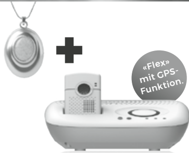
Basisgerät Flex und Medaillon Marmo

Mit dem SmartLife Care Medaillons wird der Knopf für den Notfall zum echten Schmuckstück. Mit dem Notrufgerät Flex ist das Rundum-sorglos-Paket perfekt. Ideal für aktive Träger, welche auch draussen unterwegs sind. Es kombiniert den mobilen Notruf mit einer Basisstation mit grossem Lautsprecher für zu Hause.